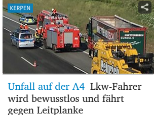
Unfall auf der A4 Lkw-Fahrer wird bewusstlos und fährt gegen Leitplanke