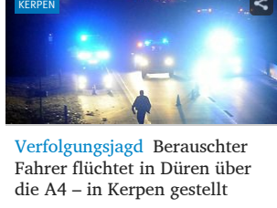
Verfolgungsjagd Berauschter Fahrer flüchtet in Dören über die A4 – in Kerpen gestellt