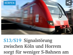
S13/S19 Signalstörung zwischen Köln und Horrem sorgt für weniger S-Bahnen am Morgen