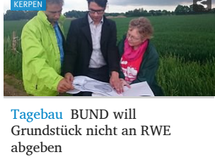
Tagebau BUND will Grundstück nicht an RWE abgeben