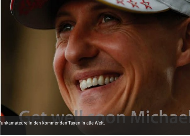
Diese Postkarte schicken die Kerpener Funkamateure in den kommenden Tagen in alle Welt.