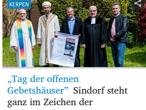
„Tag der offenen Gebetshäuser“ Sindorf steht ganz im Zeichen der Verbundenheit