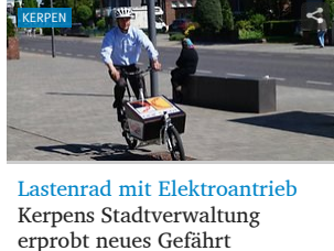
Lastenrad mit Elektroantrieb Kerpens Stadtverwaltung erprobt neues Gefährt