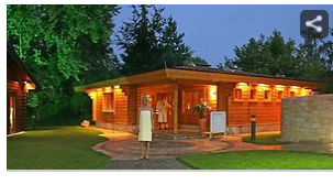
Saunen und Schwimmbäder Diese Wellnessangebote locken im Rhein-Erft-Kreis