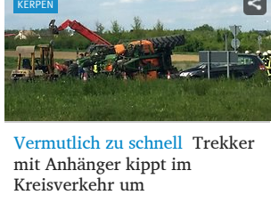
Vermutlich zu schnell Trekker mit Anhänger knnnt im Kreisverkehr um