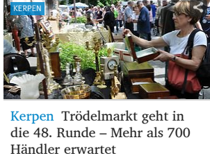
Kerpen Trödelmarkt geht in die 48. Runde – Mehr als 700 Händler erwartet