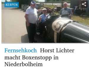
Fernsehkoch Horst Lichter macht Boxenstopp in Niederboheim