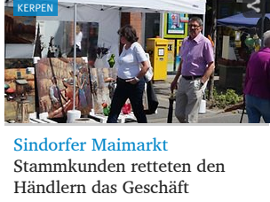
Sindorfer Maimarkt Stammkunden retteten den Händlern das Geschäft