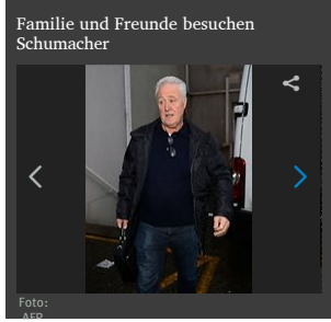
Familie und Freunde besuchen Schumacher

Wer auch immer dieses Signal auffangen kann, soll antworten und seine Adresse nach Kerpen durchgeben. Seit Freitag sitzen Zweierteams jeweils drei Stunden lang an den Funkgeräten in Horrem und versuchen, die Adressen aus dem Stimmenwirrwarr des Funkverkehrs herauszuhören und niederzuschreiben, erklärt Pisters.