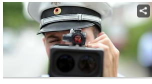
Radarkontrollen Hier wird im Rhein-Erft-Kreis geblitzt