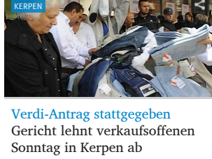
Verdi-Antrag stattgegeben Gericht lehnt verkaufsoffenen Sonntag in Kerpen ab