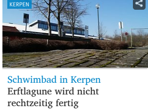
Schwimmbad in Kerpen Erftlagune wird nicht rechtzeitig fertig