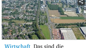
Wirtschaft Das sind die größten Unternehmen im Rhein-Erft-Kreis