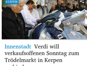
Innenstadt Verdi will verkaufsoffenen Sonntag zum Trödelmarkt in Kerpen verhindern