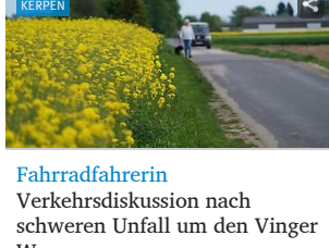
Fahrradfahrerin Verkehrsdiskussion nach schweren Unfall um den Vinger Weg