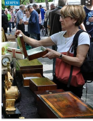
Trödelmarkt in Kerpen Auch OVG kippt verkaufsoffenen Sonntag