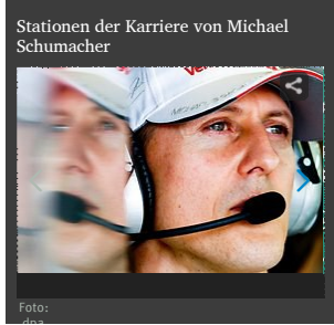
Stationen der Karriere von Michael Schumacher